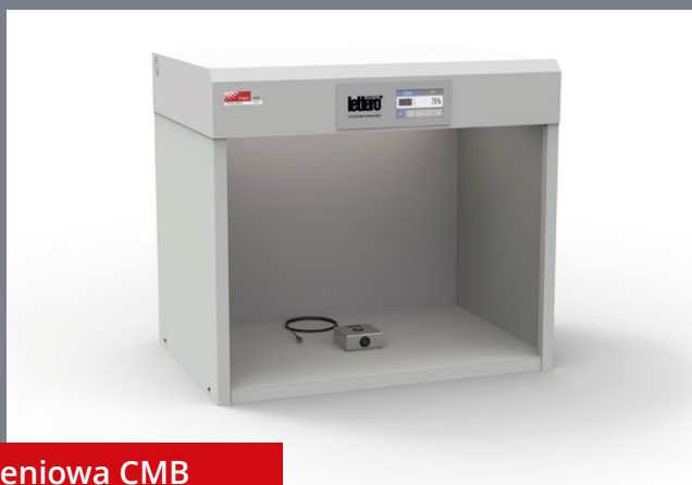
Kabina oświetleniowa CMB

W obydwu przypadkach oprogramowanie kalibratora pozwala na zdalne połączenie z serwisem lettero i w ramach nadzoru produkcyjnego dokonywania bieżącej kontroli parametrów i zdalnych korekt w czasie rzeczywistym, pod kontrolą specjalisty Lettero. Po wykonanej kalibracji zostaje wystawiony certyfikat zgodności parametrów oświetlenia z wymaganą normą.