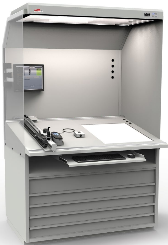
Stanowisko kontrolne CCS

W drugim wariantcie zastosowanie miernika jako oddzielnego urządzenia możliwe jest dzięki przystosowaniu kabin oświetleniowych i stanowisk kontrolnych do jego podłączenia przez port USB. Kalibrator może być wówczas udostępniony w uzgodnionym z Klientem czasie tylko na okres pomiarów i kalibracji.